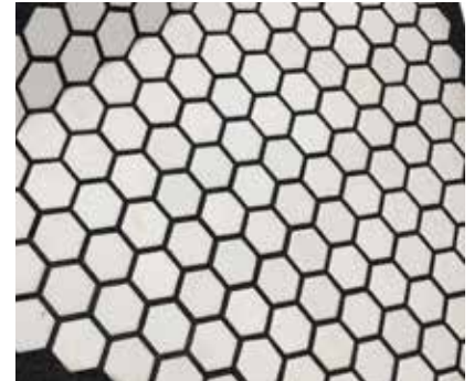
Verfugen von Aluminiumoxidfliesen