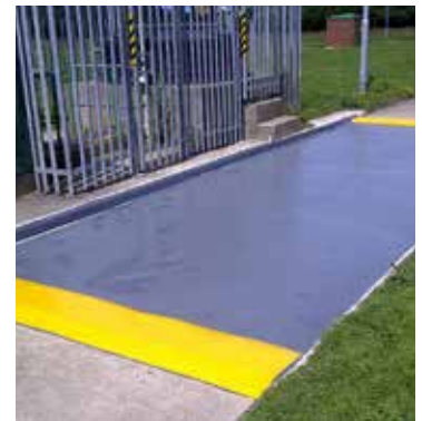
Dank der hohen Druckfestigkeit ideal für chemische Verlade- oder Füllbereiche geeignet