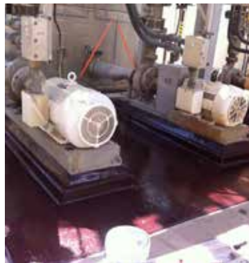
Der einfache Auftrag mit dem Pinsel schützt verschiedene Geometrien vor einer Beschädigung durch Chemikalien.

Belzona 4311 hält dem hohen Druck und Belastungen durch Fahrzeug- und Fußgängerverkehr stand.