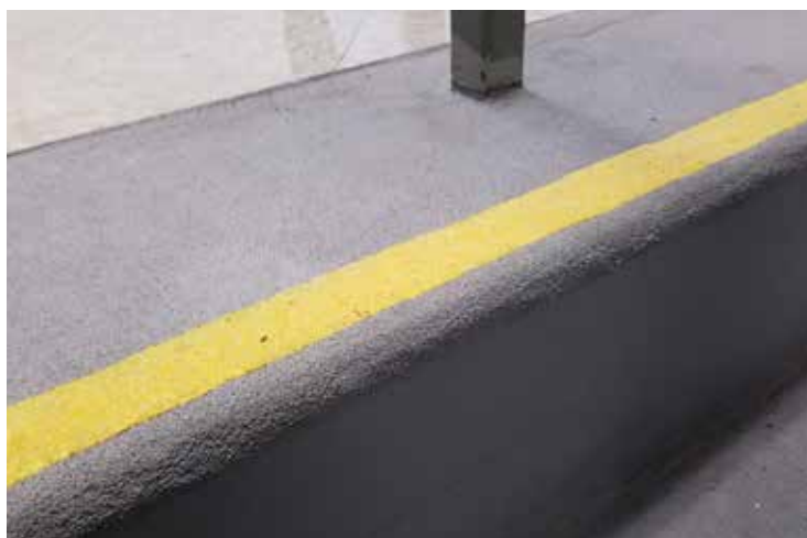
Nahaufnahme von Belzona 4411 nach mehr als einem Jahr im Einsatz

Dieses System lässt sich einfach mit dem Pinsel auftragen. Heiße Arbeiten und Spezialwerkzeuge sind nicht erforderlich.