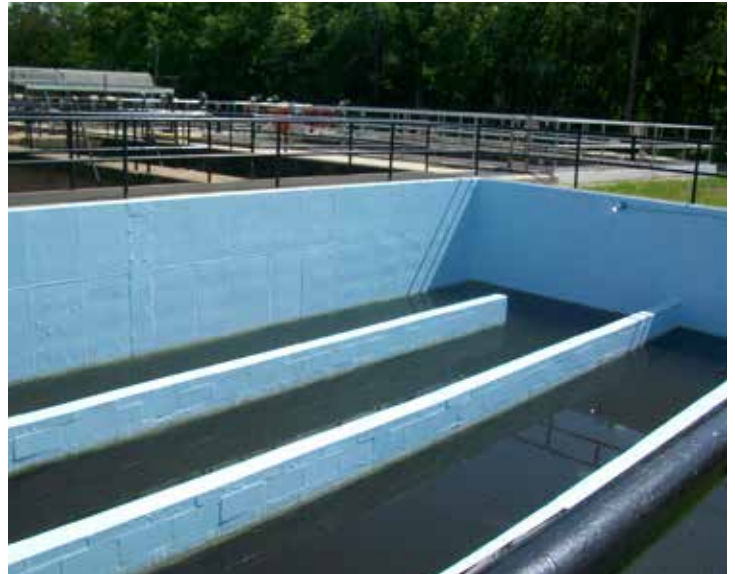
Belzona 5111 schützt die Wand eines Chlortanks.

Diese Beschichtung besitzt eine wasserdichte und chemisch beständige Oberfläche, die mit normalen Reinigungsmitteln leicht zu reinigen ist.