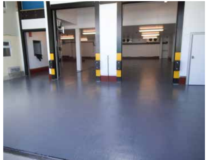
Mit Belzona 5231 wiederhergestellter Boden in einer Molkerei

Dieses lösungsmittelfreie System lässt sich leicht mischen und ohne Heißarbeiten oder Spezialwerkzeuge mit der Rolle auftragen.