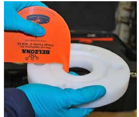
Verwendung des Flanschflächenform-Kits