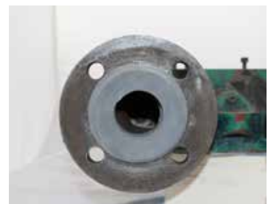
FORM ABGENOMMEN, NEUE FLANSCHFLÄCHE SICHTBAR