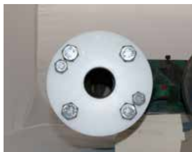
BELZONA UND FORM ANGEBRACHT