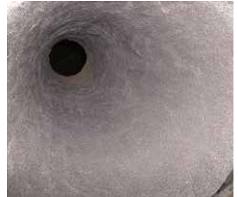
Mit Belzona 1812 beschichteter Stahlkegel

Weitere Informationen erhalten Sie von Ihrem Belzona-Ansprechpartner vor Ort.